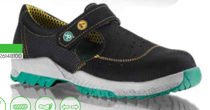
→ DAVID ART.-NR.: s1341a426148100

EN ISO 20345:2011 SIP HI/CI SRB GR.: 39-47