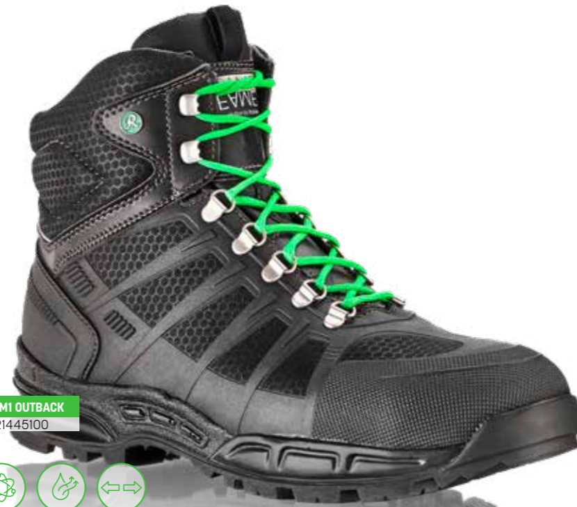
→ SEAMEX® M1 OUTBACK ART.-NR.: s4600e121445100

AUSSEN NAHTLOS UND SPORTLICH → INNEN VIEL LUFT ZUM ATMEN.