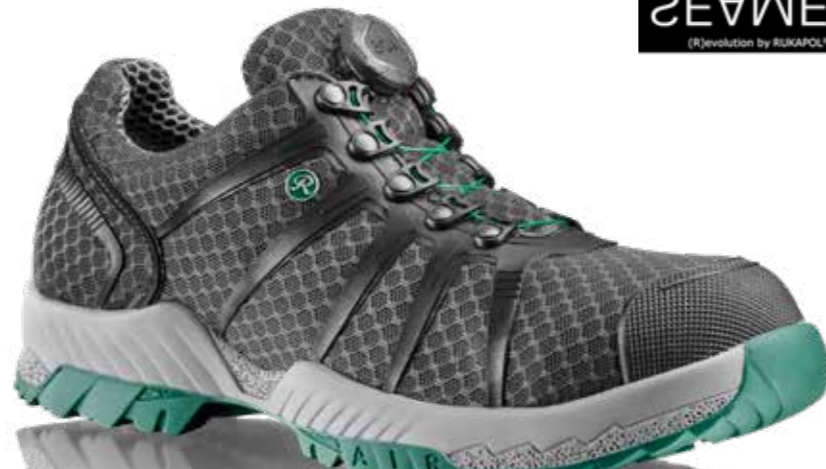
→ SEAMEX® AIR ANTHRACIT ART.-NR.: s1460g426148100

EN ISO 20345:2011 SIP HI/CI SRB GR.: 39-47