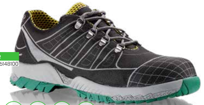
→ JUST_AIR ART.-NR.: s1440j426148100

EN ISO 20345:2011 SIP HI/CI SRB GR.: 39-47