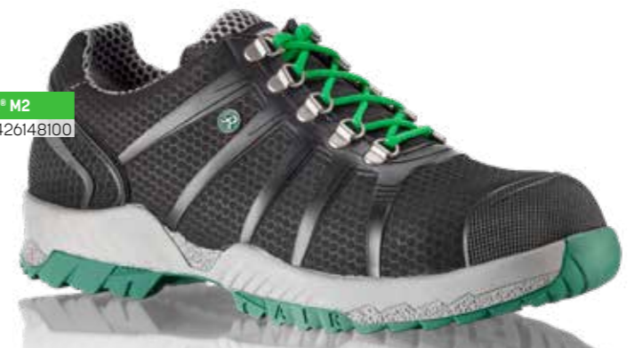
→ SEAMEX® M2 ART.-NR.: s1460b426148100