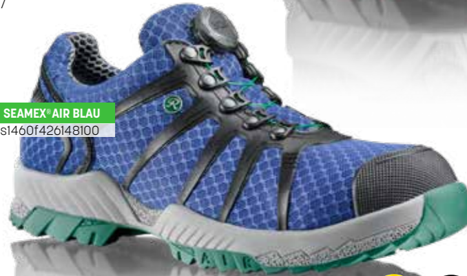
→ SEAMEX® AIR BLAU ART.-NR.: s1460f426148100