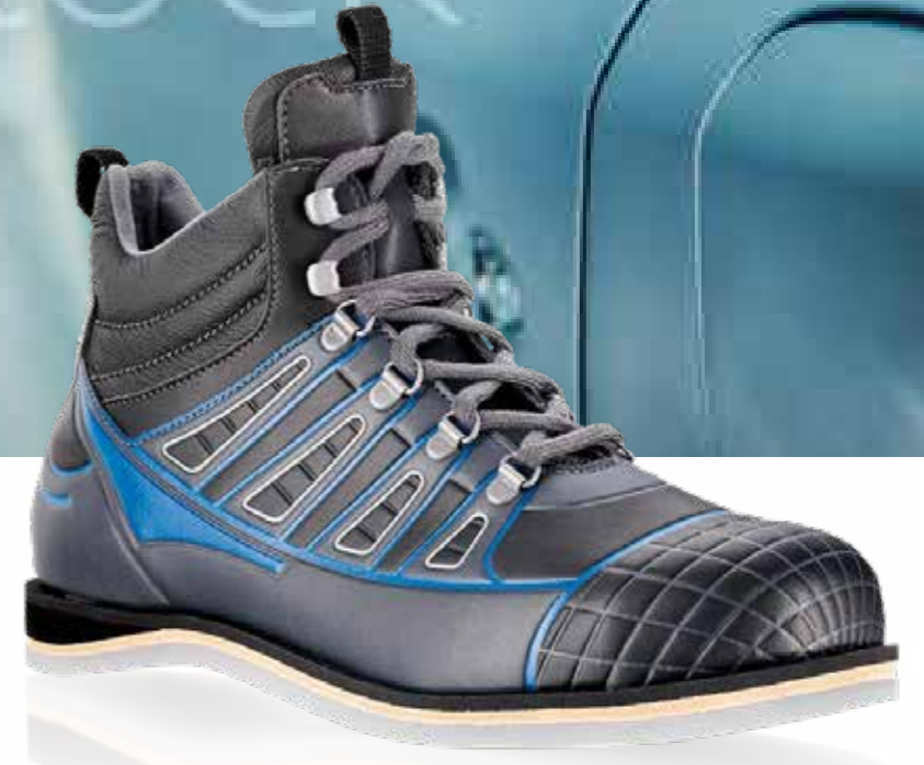
—> TIM_LACKIERER ART.-NR.: s0431s981148100