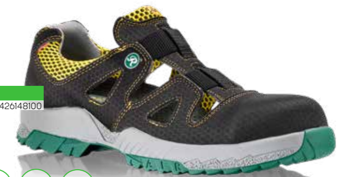
→ TOBIAS ART.-NR.: s1340a426148100

EN ISO 20345:2011 SIP HI/CI SRB GR.: 39-47