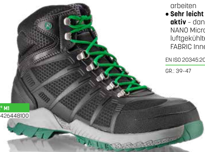
→ SEAMEX® M1 ART.-NR.: s4600b426448100

EN ISO 20345:2011 S3 HI/CI SRB GR.: 39-47