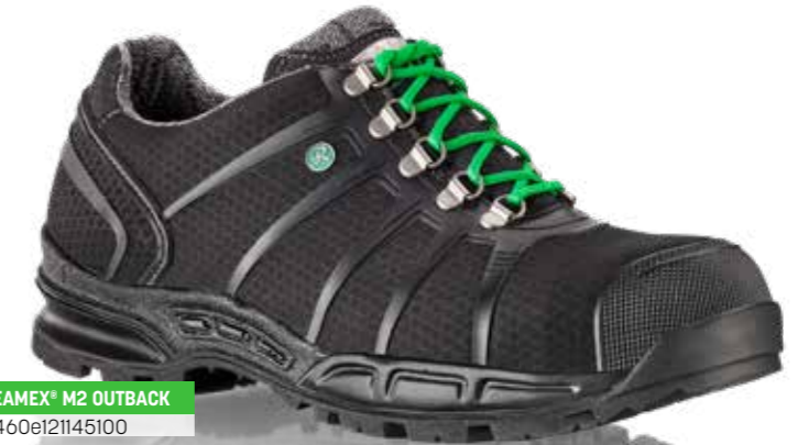
→ SEAMEX® M2 OUTBACK ART.-NR.: s1460e121145100

EN ISO 20345:2011 S3 CI SRA WR GR.: 39-47